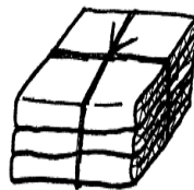
② ダンボール ※断面が波状の板紙