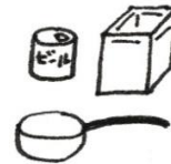
④ アルミ缶・スチール缶・一斗缶・鍋などの金属類 ※A4以上の大きさ